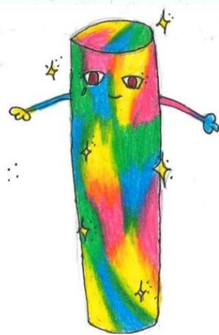
Lajkó Nikolett - Egy fehér kréta színes története