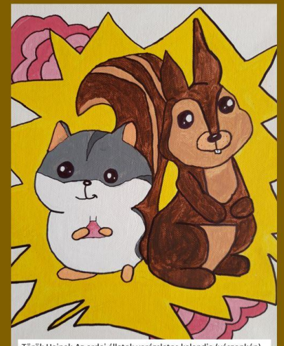
Török Hajnal: Az erdei állatok varázslatos kalandja (vászonkép)