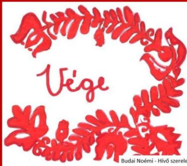
Budai Noémi - Hívó szerelem