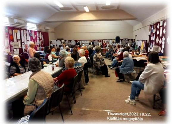
Tiszasziget, 2023.10.22. Kiállítás megnyitása