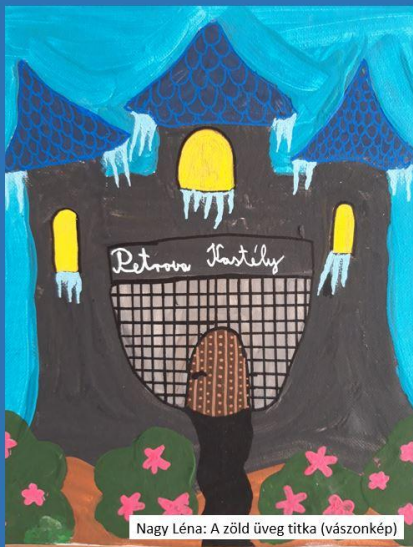
Nagy Léna: A zöld üveg titka (vászonkép)