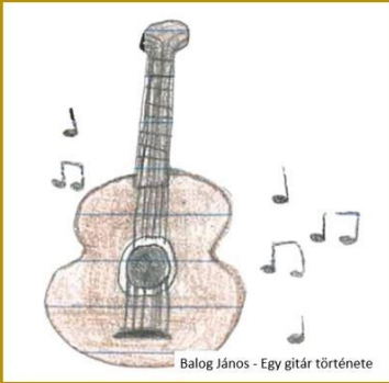
Balog János - Egy gitár története