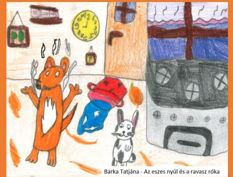
Barka Tatjana - Az eszes nyúl és a ravasz róka