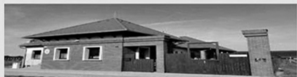
Szenvedélybetegek Nappali Intézménye és Szenvedélybetegek Alacsonyküszöbű Ellátása