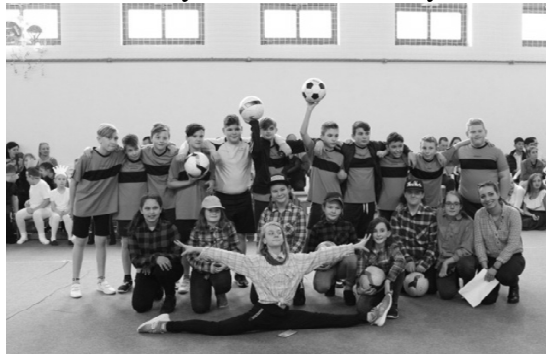
6. osztály: Olimpiai sportágak