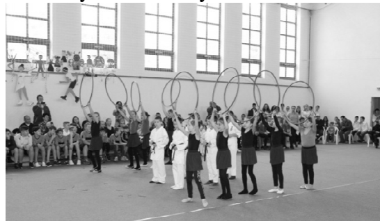
5. osztály: Focisták és a lányok