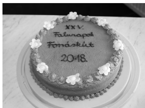
Zádori Olga: Vendégváró torta