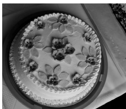
Oláh Ferenc: Fehércsokis krémsajt torta