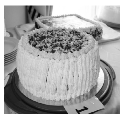
Süveges Mónika: Barackos kekszes bocitorta