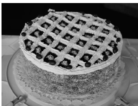
Oláh Ferenc: Fehércsokis krémsajt torta