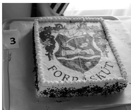
Oláh Ferenc: Fehércsokis krémsajt torta