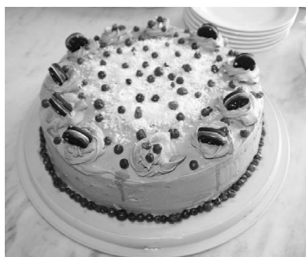
Faragó Norbert: Oreos csokoládétorta